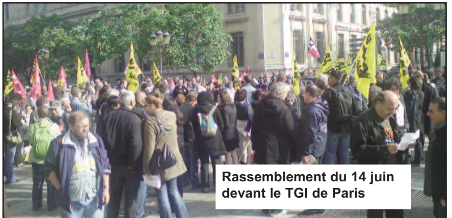
Rassemblement du 14 juin devant le TGI de Paris