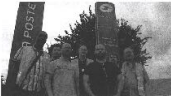
Gennevilliers, le samedi. Les employés de La Poste ont exécuté une opération pour démolir le plateau central (plus des salariés) pour les besoins de la Poste (L'ÉCR)

Gennevilliers : exposés aux poussières de toner, les postiers se font un sang d'encre